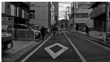
自車に接近の可能性があるもの(見えているもの)を探す

ここでは①～③で学んだことを踏まえ、リスクが高い道路にて『一歩進める安全運転』を実践します。