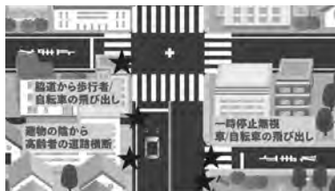
自車から見えないもの(死角)を探す