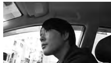
繰り返し確認し、変化を探す